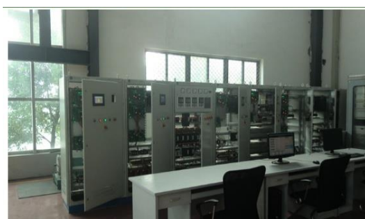
分布式发电与微电网平台