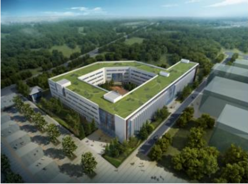
军民融合研究院鸟瞰图