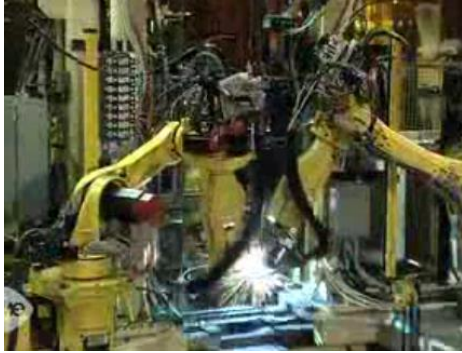
机械工程学院研发的焊接机器人