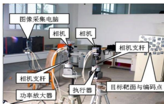
复杂环境下机器视觉研究平台

与国网四川省电力公司、技研新阳集团等单位建立了产学研联合培养基地和社会实践基地。研究生在“中国研究生电子设计竞赛”、“挑战杯”等国内外学科竞赛中多次获国家级奖项。