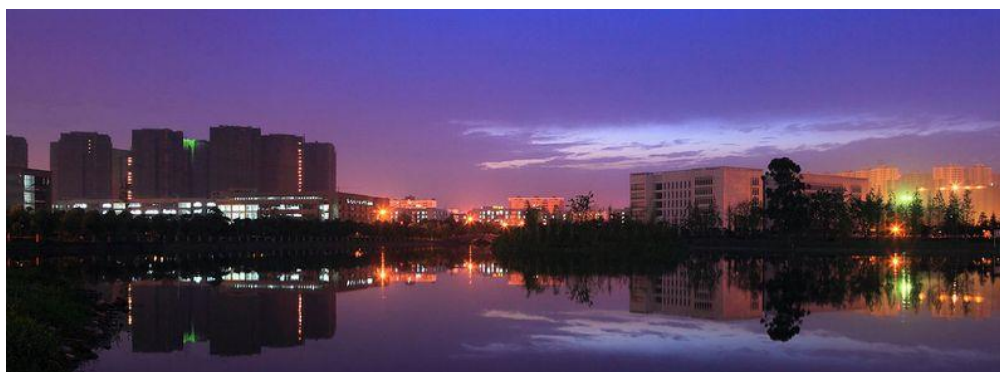
西华大学校园环境

目前西华-北航天府研究院研究生培养基地围绕北京航空航天大学5名院士的团队建立，拥有包括院士、知名专家在内的研究生指导教师28名，其中博士生导师19名。2018年已完成第一批招生，2019年拟招收研究生20名，覆盖的学科专业领域有材料科学与工程、交通运输工程、动力工程及工程热物理等。