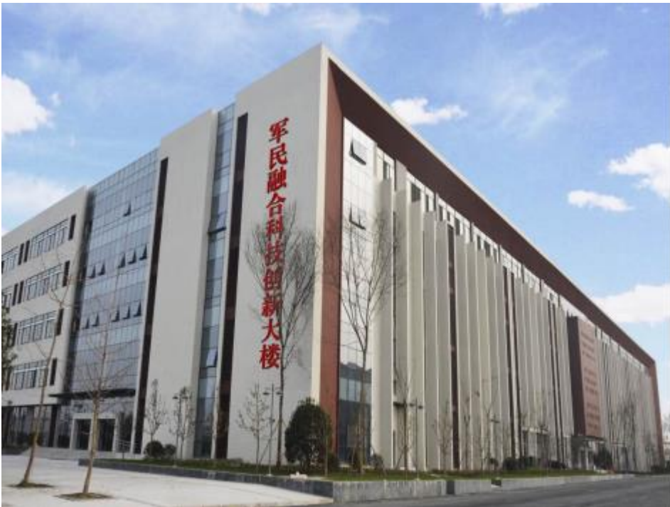
军民融合科技创新大楼